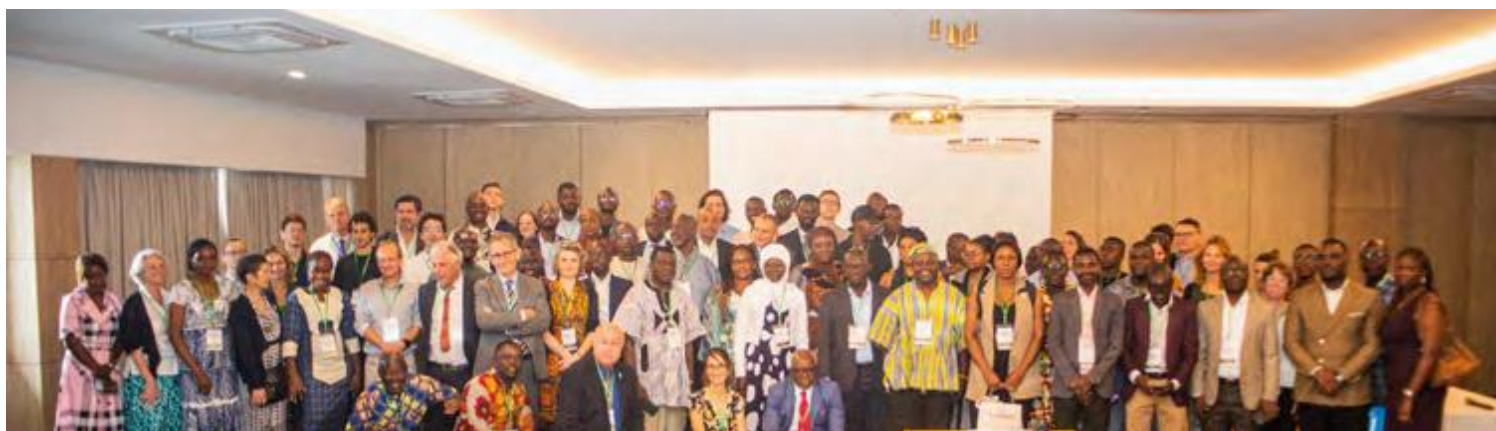
Les 94 participants du séminaire international sur la préservation et la restauration des sols forestiers en Afrique de l'Ouest

Pour atteindre ces objectifs, le séminaire s'appuyait sur la CEDEAO et la mobilisation d'acteurs institutionnels, scientifiques, de la société civile et des filières agricoles et forestières d'Afrique de l'Ouest. Cette mobilisation a été rendue possible grâce à l'alliance des réseaux du MEMINADER, de l'Initiative « 4 pour 1000 », et du CIRAD, co-organisateur de l'événement.